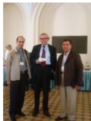
با پروفیسور اهلرز

ظهر روز بعد مراسم پذیرش و ثبت نام کنفرانس در دانشگاه یاگلونیا کراکف به عمل آمد. کنفرانس ساعت 9 بامداد روز چهارشنبه 20 ماه می 2009 در تالار دانشگاه مزبور با سخنان رئیس بخش مطالعات شرقی دانشگاه آغاز شد و پس از گزارش دبیر کنگره خانم کارولینا راکوویکا با سخنرانی کلیدی پروفیسور اکارت اهلرز استاد ممتاز دانشگاه بن (آلمان) با عنوان «شهر شرقی: چشم انداز جغرافیایی» ادامه یافت.