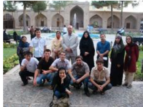
کاروانسرای عباسی نیشابور