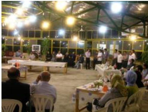
آلاچیق پارت لاستیک

این ترتیب، این جلسه نیز خود برای دانش افزایان مانند یک کلاس درس بلکه بهتر از آن، موجب دانش افزایی زبانی آنان بود.