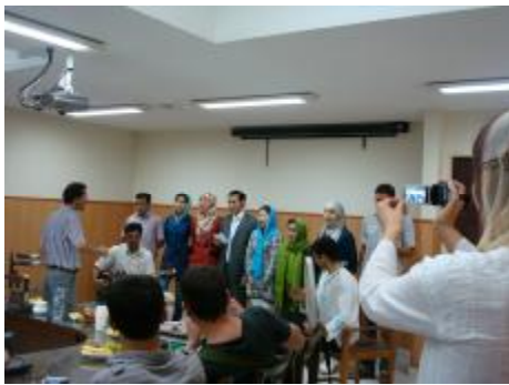
اجرای سرود ای ایران

دربارهٔ دوران اقامت خود در ایران اظهار نظر کردند و اشعاری هم به مناسبت توسط دانش پذیران قرائت گردید.