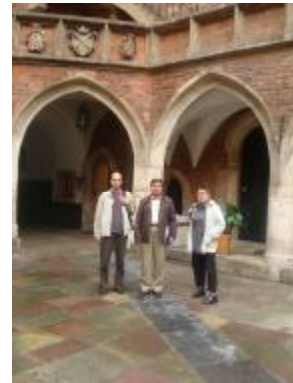
با پروفیسور کراسنولسکا

بازدید، تبادل نظر و همکاری گروهی از همکاران و دانشجویان دکتری قطب علمی فردوسی‌شناسی دانشگاه فردوسی از دانشگاه یاگلونیای کراکف در تابستان آینده به عمل آمد.