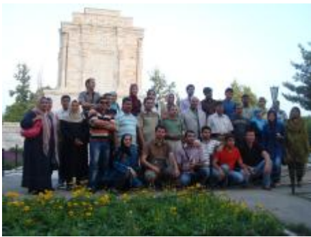
در آرامگاه فردوسی