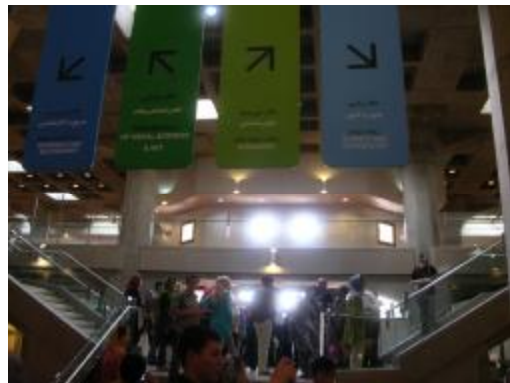
کتابخانه ملی تهران

ضيافت ناهار ریاست سازمان و دورد و بدرود با آنها که در تهران می‌مانند برای عزیمت به کشورهای خودشان.