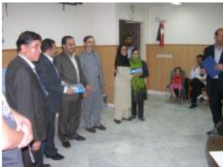
مراسم اعطای گواهی دوره

بعد گروه موسیقی سنتی به اجرای موسیقی محلی و مقامی پرداختند و سرود «ای ایران» نیز توسط گروه سرود دانش پذیران اجرا گردید. در پایان به دانش پذیران گواهی شرکت در دوره اعطا شد.