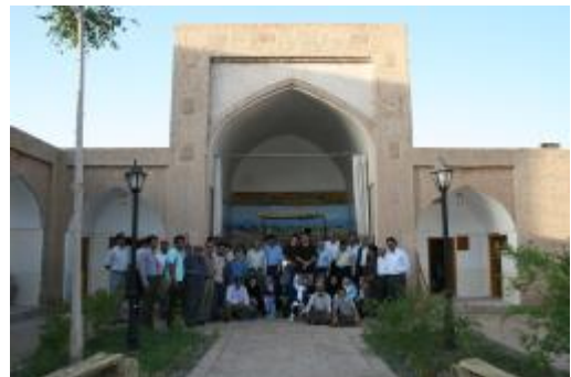
مسجد جامع گناباد