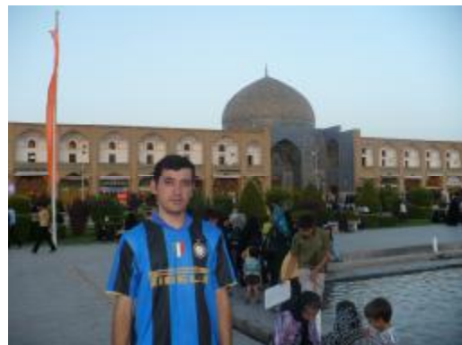
مسجد شیخ لطف‌الله