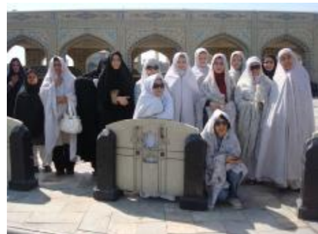
ورودی حرم مطهر

کتب خطی و چاپی کشور و بلکه جهان است، به عمل آمد و همه جا با توضیحات فنی و سودمند راهنمایان روابط عمومی کتابخانه همراه بود. توفیق استفاده از خوان معنویت امام همام، به دلیل گستردگی البته برای هرکسی به قدر همت او فراهم است، اما امکان استفاده از خوان نعمت مادی حضرتش به دلیل محدودیت امکانات و خیل عظیم متقاضیان برای همه کس فراهم نیست، با تمهیداتی که در آستان قدس رضوی اندیشیده شده است، تنها به معدودی از زائران بیرون از مشهد و خراسان منحصر شده است. به همین منظور با برنامه ریزی قبلی و مکاتباتی که صورت پذیرفته بود، استثنائاً مهمانان ما توانستند، پس از ارائه پاسپورت، برسر خوان نعمت مادی امام همام بنشینند و ناهار متبرک را همزمان با دیگر زائران داخلی و خارجی در مهمانسرای حضرت صرف کنند.