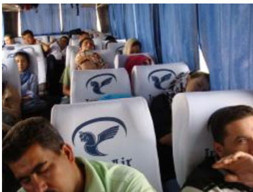
داخل اتوبوس در مسیر اصفهان